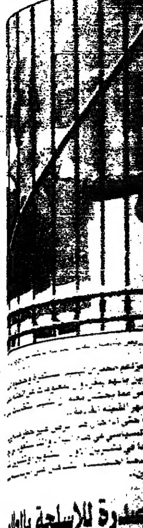
أساسية في روسيا

بغداد - ف.ب. - ذكرت صحيفة «الشرق الأوسط» ان أساسية في روسيا.